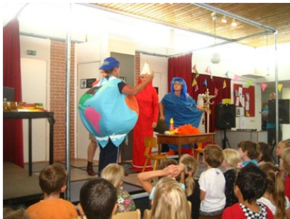
Meer foto's op www.blinkertschool.nl

"Ik vond het toneelstuk ook leuk voor groep 8. Vorig jaar was het wat kinderachtiger. Dit jaar was veel leuker. De rap was ook erg leuk. Het paste heel erg bij onze school. Ik vond het ook leuk dat de directeur snoepjes aan. Zou meester Rob dat ook doen? Maar dat zal wel niet. De kleding was ook goed. Het veranderde steeds. Zoals bij het potlood en de gum."